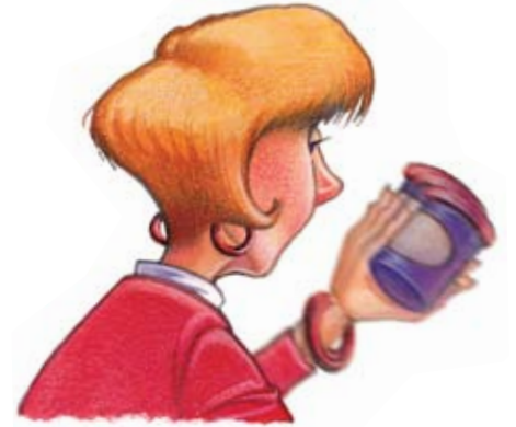
رؤية غير واضحة