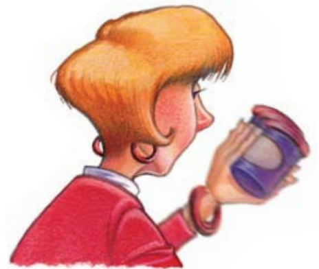
Appannamento della vista