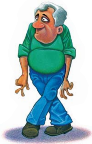
Frequente bisogno di urinare