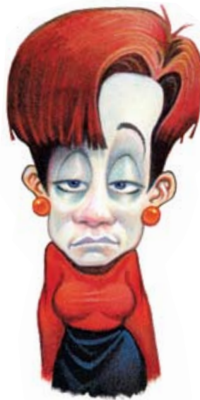
Sovraffaticamento e pallidezza