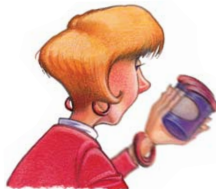
ਪੁੰਦਲਾ ਨਜ਼ਰ ਆਉਣਾ