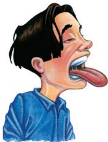
ਮੂੰਹ ਖੁਸ਼ਕ ਹੋਣਾ