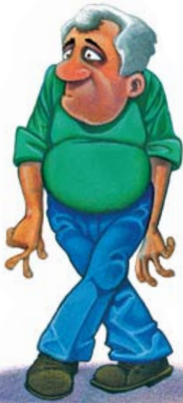
Frecuentes deseos de orinar