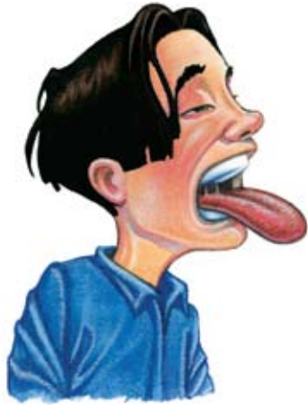
Sequedad de la boca