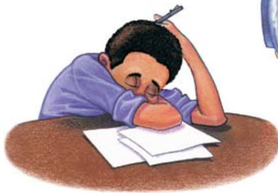
Uể oải buồn ngủ